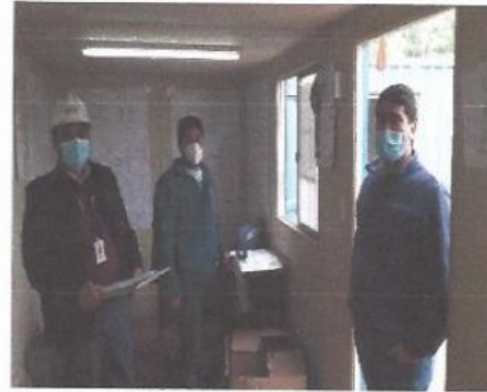
Imagen 7. Registro fotográfico reunión Coordinador del Plan de Zonas Rezagadas, Asistente Técnico de Obras y Contratista.