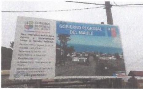
Imagen 1. Letrero informativo iniciativa.