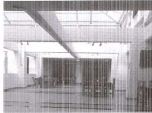
Imagen 2. Instalaciones Mercado Municipal de Quirihue.