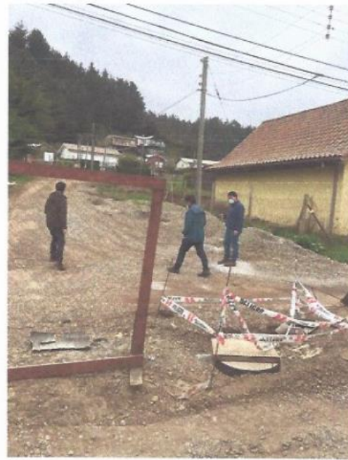
Imagen 3. Registro fotográfico avance obras civiles.