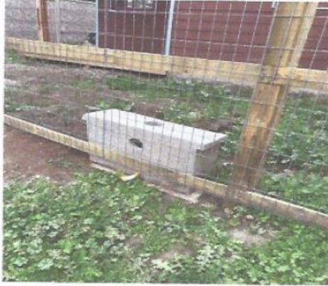
Imagen 4. Registro fotográfico avance obras civiles.