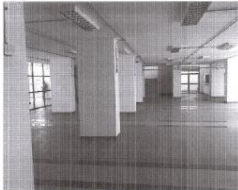
Imagen 1. Registro fotográfico por visita al Mercado en Noviembre de 2019.