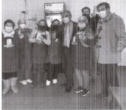
Imagen 4. Registro fotográfico de algunas beneficiarias, Alcalde de la comuna de Quirihue y Coordinador Plan de Zonas Rezagadas.