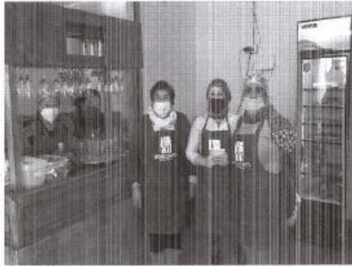
Imagen 5. Registro fotográfico de algunas beneficiarias del Mercado Municipal de Quirihue.