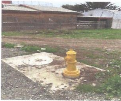
Imagen 6. Registro fotográfico avance obras civiles.