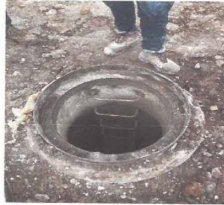
Imagen 5. Registro fotográfico avance obras civiles.