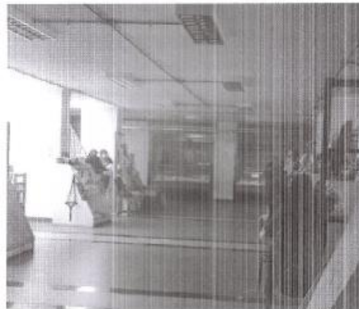
Imagen 3. Instalaciones Mercado Municipal de Quirihue.