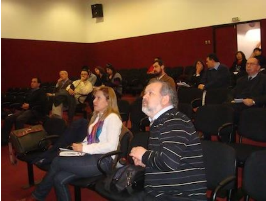
Taller Antofagasta (Universidad Católica del Norte, 3 de agosto de 2009)