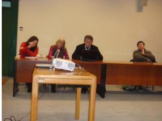
Taller Bio-Bio (Universidad del Bío-Bío, 31 de julio de 2009).