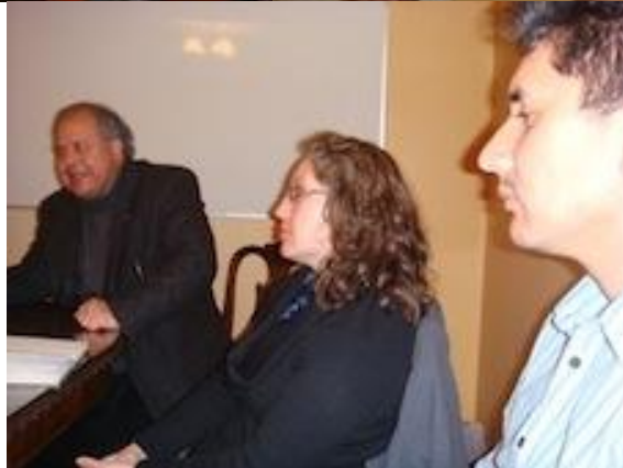
Taller Valparaíso (Centro de Estudios Regionales Valparaíso; 5 de agosto de 2009)