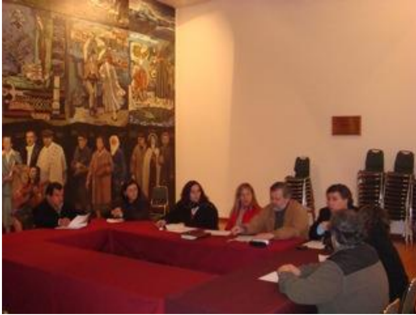
Taller Maule (Universidad de Talca, 24 de julio de 2009).