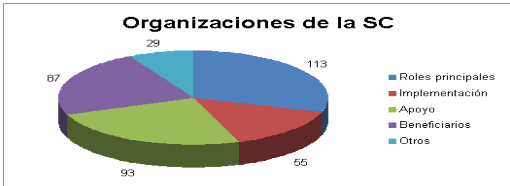
Gráfico N° 2 Roles de los actores en experiencias postuladas por la Sociedad Civil

En ambos casos, sin embargo, en cerca de la mitad de las relaciones o vínculos que se establecen en las experiencias se están generando procesos compartidos de toma de decisiones y financiamiento que interesa observar en profundidad, ya que están dando cuenta del tipo de diálogo y articulación que se está produciendo entre casi 500 instituciones públicas y de sociedad civil vinculadas en las prácticas analizadas.